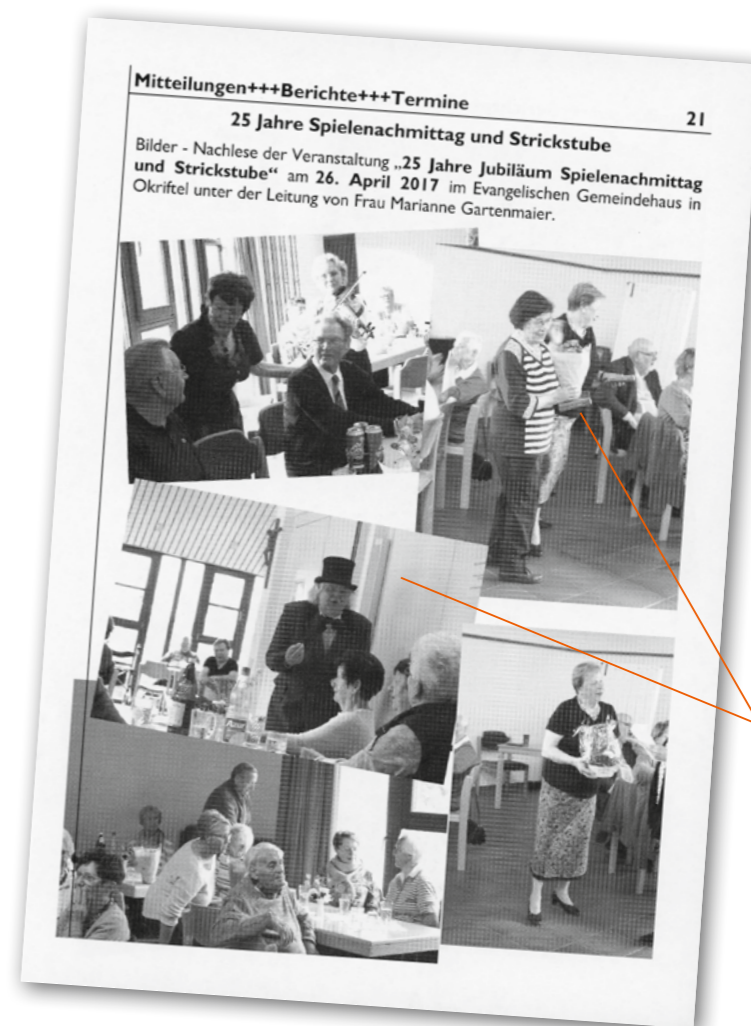
Mitteilungen+++Berichte+++Termine 25 Jahre Spielenachmittag und Strickstube

Wie Veranstaltungs-Plakate sollten die Gemeindebriefseiten aus Hattersheim nicht gestaltet werden. Was tun, damit sie gesehen und gelesen werden? Die Texte unterschiedlicher Länge müssen durch Absätze, Initiale und vor allem durch aussagekräftige Überschriften gegliedert werden. Die Rubriken können wesentlich deutlicher ausfallen. Meinungstexte und Andachten dürfen im Flattersatz enden. Blocksatz kommt bei kürzeren Texten in Frage. Die Anordnung der Bilder muss neu konzipiert werden. Dabei darf auch an großformatige Bilder gedacht werden. Erich Franz