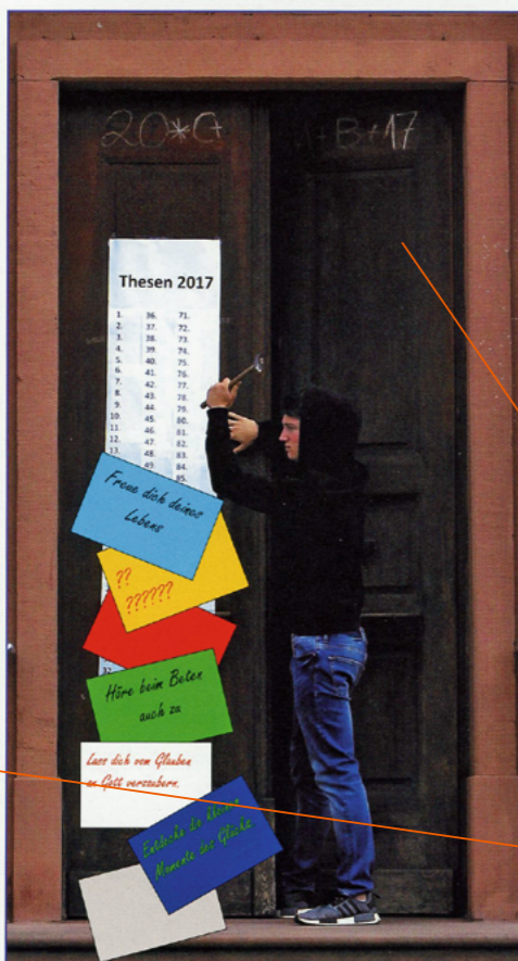
Evangelische Kirchengemeinde Eddersheim Evangelische Matthäusgemeinde Okriftel

I. September 2017 bis 30. November 2017 Nr. 16